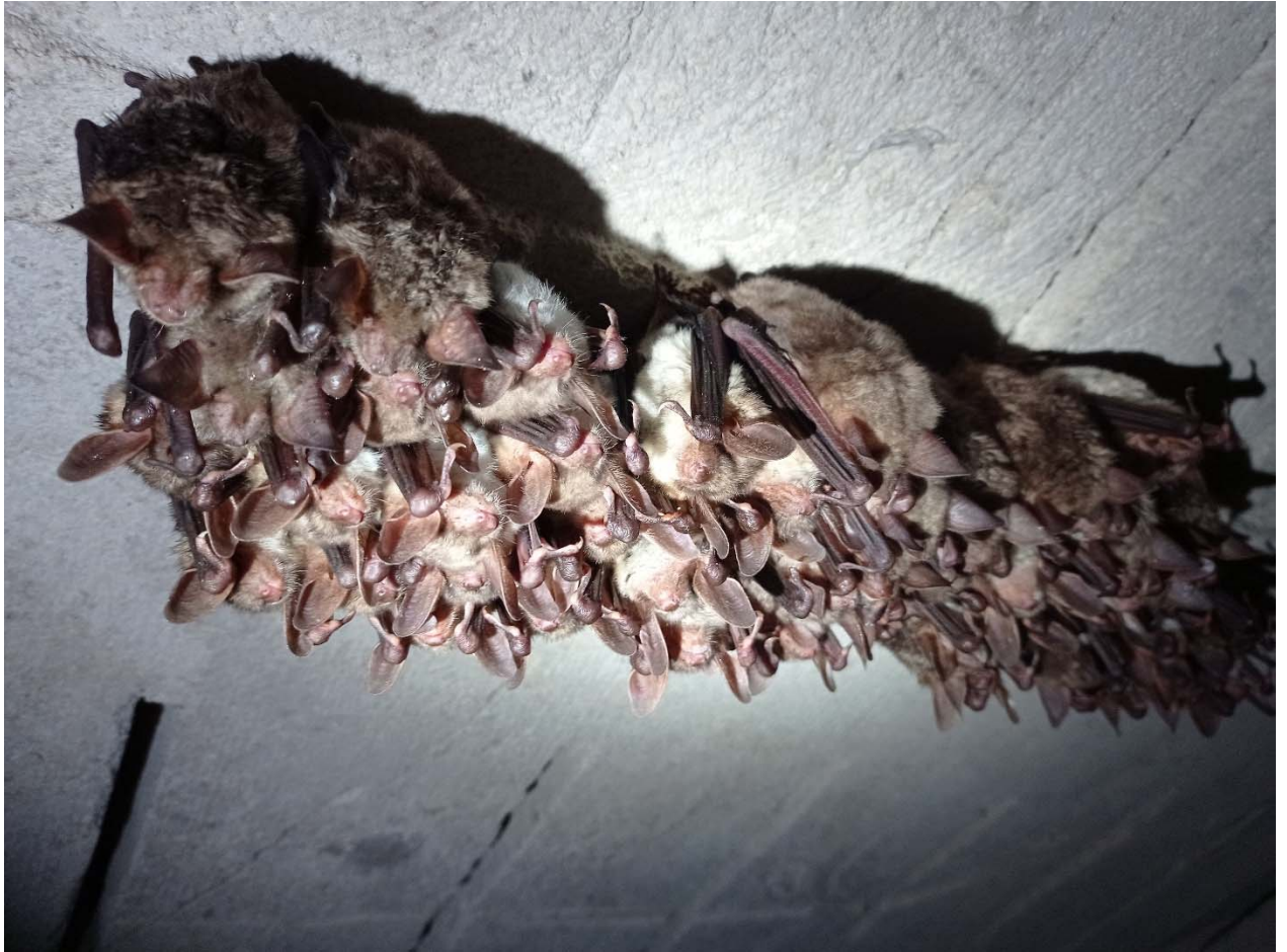
Фото 2. Зимуюча колонія Нічниці великої Myotis myotis – домінуючого виду в Гуменецькій штольні, загальна чисельність близько 2 тис. особин