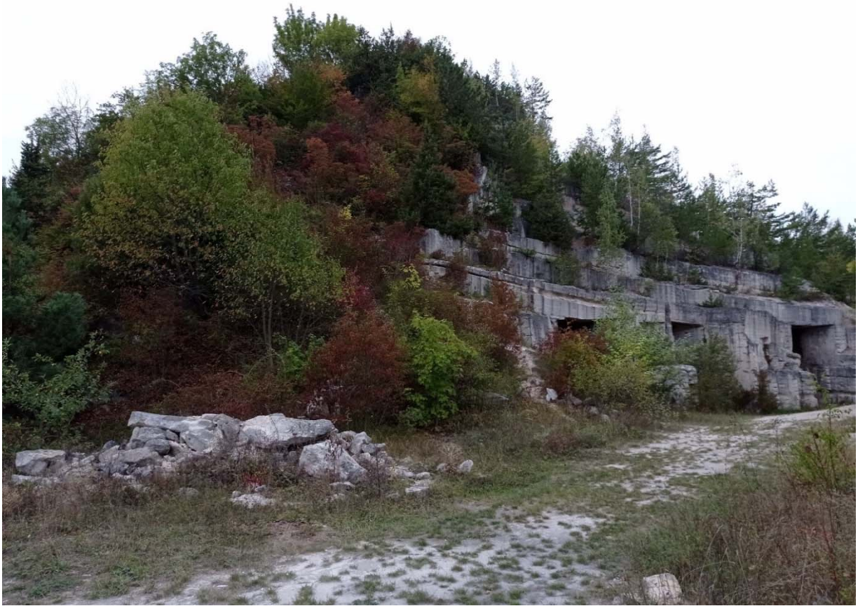
Фото 4. Привходова ділянка Гуменецької штольні, ландшафтний заказник загальнодержавного значення «Кармалюкова гора»