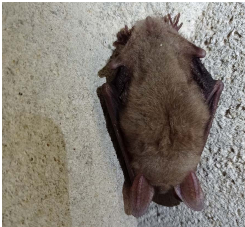
Фото 5. Нічниця довговуха ( Myotis bechsteini ) – один з найрідкісніших видів кажанів Європи на зимівлі у Гуменецькій штольні